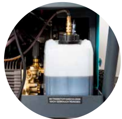
Halterung für Schaum-, Reiniger- oder Kalkfrei-Behälter