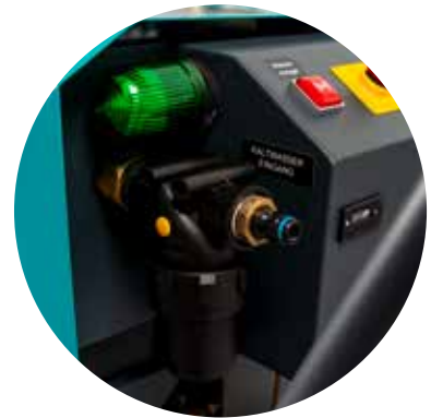
GARDENA®-kompatibler Kaltwasseranschluss mit Wasserfilter